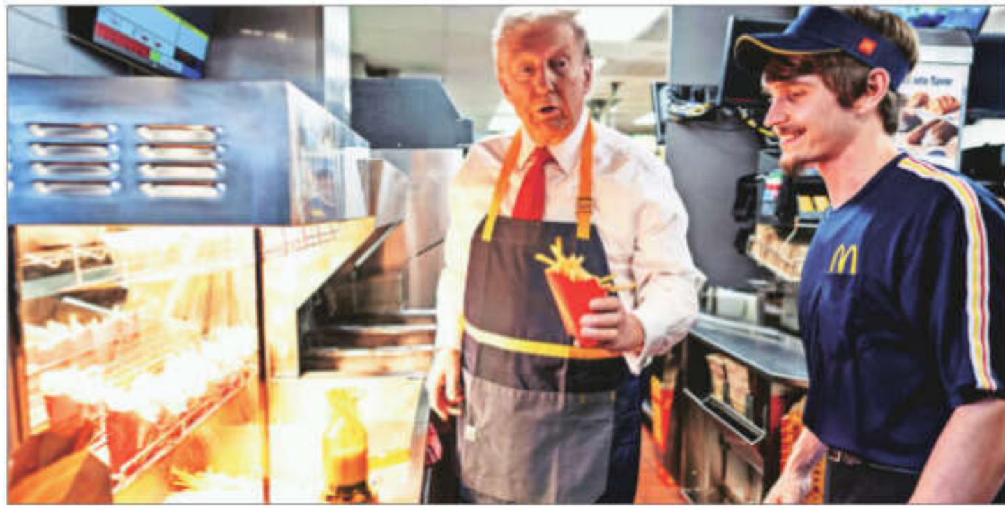
Republican presidential nominee and former US President Donald Trump works behind the counter during a visit to McDonald's in Feasterville-Trevoise, Pennsylvania, on Sunday.

Republican whose decade-long grip on the nation's politics has been fueled by his mastery of spectacle and the press, and a Democrat whose rapid trajectory has been underpinned by her deliberate and methodical approach — but also a shared underlying reality: that the 2024 election appears as close as any in the nation's history.