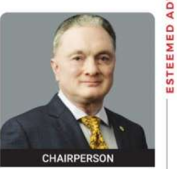
Gautam Hari Singhania CMD, Raymond Ltd.

visit etretail.com/great-india-retail-summit