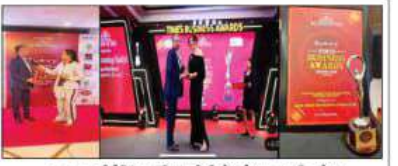
बाबा फूड प्रोसेसिंग (इंडिया) लिमिटेड ने टाइम्स बिजनेस अवार्ड्स 2024 में सफल भागीदारी की। कंपनी को वरुण सुप्रियर क्वालिटी अवार्ड मिला है।

बिजनेस डेस्क। मुंबई। बाबा फूड प्रोसेसिंग (इंडिया) लिमिटेड ने बिलिकेट के साथ सफल पंजीकरण की घोषणा की है। इस पंजीकरण के माध्यम से बाबा फूड प्रोसेसिंग (इंडिया) लिमिटेड को बाबा फूड प्रोसेसिंग (इंडिया) लिमिटेड के व्यवसाय संचालन को बढ़ाने में मदद मिलेगी। इस पंजीकरण के माध्यम से बाबा फूड प्रोसेसिंग (इंडिया) लिमिटेड को बाबा फूड प्रोसेसिंग (इंडिया) लिमिटेड के व्यवसाय संचालन को बढ़ाने में मदद मिलेगी।