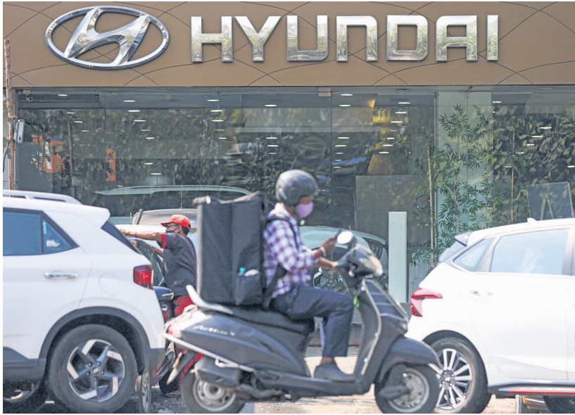
Hyundai is the latest passenger vehicle original equipment manufacturer (OEM) to report a tough second quarter in a challenging market.

The Iran-backed Houthi militants in Yemen have been attacking merchant and