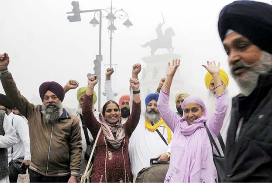
શીખ ધર્મના સ્થાપક ગુરુનાનકદેવએ તેમના જીવનના અંતિમ ૧૮ વર્ષ જ્યાં રહ્યા હતા તે પાકિસ્તાન સ્થિત કરનાપુરમાં આવેલા ગુરુદ્વાર ખાતે નાનક જયંતિ નિમિત્તે કરતારપુર પાકિસ્તાનની યાત્રાએ જઈ રહેલા શીખ શ્રદ્ધાળુઓ અમૃતસરથી રવાના થતા પૂર્વ ધાર્મિક નારા લગાવી રહ્યા છે.

લંડન, તા. ૧૪ ઉપરાંત તેઓ અનઓથોરાઈઝડ ચેનલો મારફતે પેમેન્ટ કરવાનું કહે છે. UKVIએ ભારપુલ્ય જણાવ્યું હતું કે તે ક્યારેય સોશિયલ મીડિયા દ્વારા અરજદારનો સંપર્ક કરતું નથી. આ ઉપરાંત ઈમેઈલ અથવા વ્યક્તિગત બેંક એકાઉન્ટ દ્વારા પેમેન્ટની વિનંતી કરશે નહીં અથવા થર્ડ-પાર્ટી પેમેન્ટના બદલામાં વિઝા મંજૂરીની બાંધકામ આપશે નહીં. યુકે વિઝા સર્વિસિસ માટેના તમામ પેમેન્ટ્સ ફક્ત GOV.UK અધિકારીઓ તરફથી કરવામાં આવેલા ભાગીદારો મારફતે થવા જોઈએ.