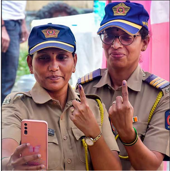
મહારાષ્ટ્ર વિધાનસભાની સામાન્ય ચૂંટણીના આગામી ૨૦ નવેમ્બરે યોજનારા મતદાન પૂર્વે મુંબઈમાં ફરજમાં રોકાયેલા મુંબઈ મહિલા પોલીસ કર્મચારીઓ પોસ્ટલ બેલેટ મારફતે પોતાના મત્તાધિકારનો ઉપયોગ કરી રહ્યા છે.