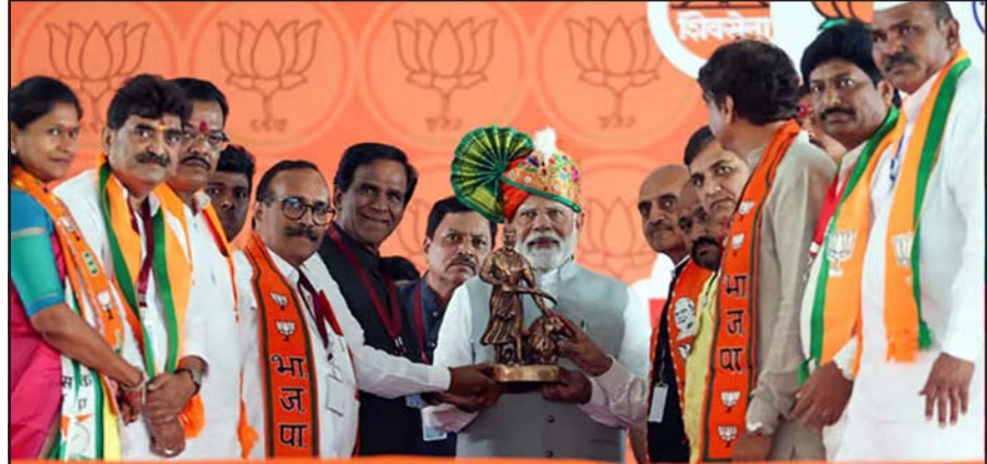
મહારાષ્ટ્રના ચૂંટણી પ્રવાસ દરમિયાન છત્રપતિ સંભાજીનગર ખાતે ભાજપની ચૂંટણી રેલીને સંબોધવા આવી પહોંચેલા વડાપ્રધાન નરેન્દ્ર મોદીનું પક્ષના સ્થાનિક આગેવાનો પીએમ મોદીનું સ્મૃતિ ચિહ્ન એનાયત કરી અભિવાદન કરી રહ્યા છે.

નવી દિલ્હી, તા. ૧૪ સુપ્રીમ કોર્ટે સરકારી નોકરીમાં રહેમરાહે કરાતી નિમણૂક અંગે મહત્વનો ચુકાદો આપ્યો છે. કોર્ટે બુધવારે જણાવ્યું હતું કે, કરુણાના આધારે અપાતી સરકારી નોકરી અધિકાર નથી. નોકરીના કાર્યકાળ દરમિયાન મૃત્યુ પામનાર કર્મચારીની શરતમાં આવો કોઈ ઉલ્લેખ હોતો નથી. સુપ્રીમ કોર્ટે ૧૯૮૭માં મૃત્યુ પામેલા પોલીસ કોન્સ્ટેબલ પિતાના પુત્ર દ્વારા કરાયેલી અરજીને નકારતી વખતે મહત્વની ટિપ્પણી કરી હતી. અરજીમાં પુત્ર સાત વર્ષનો હતો ત્યારે પિતા મૃત્યુ પામ્યા હોવાથી નોકરીની માંગણી કરવામાં આવી હતી. સુપ્રીમ કોર્ટેની બેન્ચે જણાવ્યું હતું કે, આ મુદ્દે વ્યક્તિ કે વ્યક્તિઓના જૂથની તરફથી રાજ્યને કોઈ નિર્દેશ આપી શકાય નહીં. બેન્ચે વતી ચુકાદો લખતા જજ મસિહે જણાવ્યું હતું કે, “કરુણાના આધારે નોકરીમાં કરાતી નિમણૂકનો ઈરાદો પરિવારના સભ્યના મૃત્યુ વખતે ઊભી થયેલી તાત્કાલિક નાણાકીય કટોકટીને હળવી કરવાનો હોય છે. લાંબા સમય પછી તેને અધિકાર ગણી નોકરી માટે દાવો કરી શકાય નહીં. નોકરીના કરવાનો હોય છે. ઉપરાંત, આવી નિમણૂક પોલીસમાં દર્શાવેલી શરતોને આધિન હોય છે. સુપ્રીમ કોર્ટે અરજદાર ટિકુના કેસની સુનાવણી વખતે તમામ સ્પષ્ટતા કરી હતી. જેમાં ટિકુના પિતા જયપ્રકાશ ૧૯૮૭માં ફરજ બજાવતી વખતે અન્ય ઓફિસર સાથે મૃત્યુ પામ્યા હતા. એ વખતે ટિકુ સાત વર્ષનો હતો. ટિકુની માતા નિરજાર હોવાથી કરુણાના આધારે પોતાના માટે નોકરીની અરજી કરી શકે તેમ નહીં હોવાથી તેમણે ‘સગીરો માટેના રજિસ્ટર’માં પુત્રનું નામ લખાવ્યું હતું. જેથી પુત્ર વયના થયા પછી પુત્રને નોકરી મળી શકે. જોકે, ટિકુએ ૨૦૦૮માં નોકરી માટે અરજી કરી ત્યારે પિતાના મૃત્યુને ૧૧ વર્ષ પસાર થઈ ચૂક્યા હોવાથી અંથો રીટીએ તેની અરજી નકારી કાઢી હતી. જેની સામે ટિકુએ કોર્ટમાં અરજી કરી હતી.