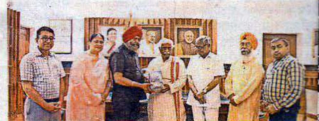
ਪੁਸਤਕ 'ਖ਼ਿਆਲ ਤੋਂ ਤਹਿਰੀਰ ਤੱਕ' ਲੋਕ ਅਰਪਣ ਕਰਦੇ ਹੋਏ ਹਰਿਆਣਾ ਦੇ ਰਾਜਪਾਲ ਬੰਡਾਰੂ ਦੱਤਾਤ੍ਰੇਆ ਤੇ ਹੋਰ ਸ਼ਖ਼ਸੀਅਤਾਂ।