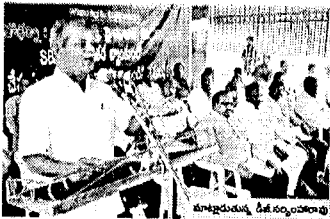
సవలింగాణ - మహిళా శాఖ

మహిళా శాఖ, సవలింగాణ - మహిళా శాఖ కార్యదర్శిని కేంద్రంగా చేసుకుని ప్రజాసేవలను అందించడం ప్రధాన లక్ష్యంగా ఉండాలి అని క్యాబినెట్ సభ్యులు ఆంధ్రప్రదేశ్ ప్రభుత్వం నిర్ణయించింది. ఆంధ్రప్రదేశ్ ప్రభుత్వం నిర్ణయించిన ప్రకారం, క్యాబినెట్ సభ్యులను క్రమబద్ధీకరించాలి అని ప్రకటించింది. ఇందుకు అనుగుణంగా, క్యాబినెట్ సభ్యులను క్రమబద్ధీకరించాలి అని ప్రకటించింది. ఆంధ్రప్రదేశ్ ప్రభుత్వం నిర్ణయించిన ప్రకారం, క్యాబినెట్ సభ్యులను క్రమబద్ధీకరించాలి అని ప్రకటించింది.