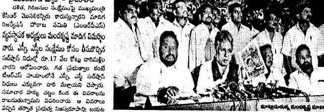
సవలింగాణ - మహిళా శాఖ

సవలింగాణ - మహిళా శాఖ కార్యదర్శిని కేంద్రంగా చేసుకుని ప్రజాసేవలను అందించడం ప్రధాన లక్ష్యంగా ఉండాలి అని క్యాబినెట్ సభ్యులు ఆంధ్రప్రదేశ్ ప్రభుత్వం నిర్ణయించింది. ఆంధ్రప్రదేశ్ ప్రభుత్వం నిర్ణయించిన ప్రకారం, క్యాబినెట్ సభ్యులను క్రమబద్ధీకరించాలి అని ప్రకటించింది.