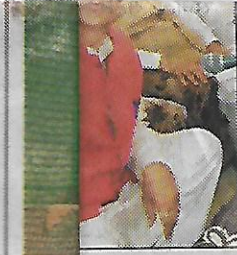
माप्रकाश धनखड़ ने कला और कलौड़ जोड़ा गया क मिलेगी निःशुल्क रोहतवों में आंगी जागृति

बाँडंडा। सराय रोहिल्ला बीकानेर सुपरफास्ट एक्सप्रेस ट्रेन में शनिवार देर रात करीब सवा एक बजे मंकी कैप लगाए तीन-चार लुटेरों ने वारदात को अंजाम दिया। इन लुटेरों ने राजस्थान के श्रीगंगानगर निवासी व हरियाणा पुलिस की हेड कांस्टेबल के पति को चाकू दिखाकर लूट लिया तो बाँडंडा के दो परिवारों को भी शिकार बनाया।