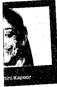
Anil Kapoor worth as close to $80 mil-

initial investment, after accounting for dilution in their holdings, according to estimates compiled by ET. The family office, an investment model first conceptualised in the 19th century by the Rockefeller family, amongst the wealthiest and most powerful business families in America, has become popular as a tool for efficient allocation and protection of wealth by the ultra-rich. "We are seeing the family office concept becoming more popular in a lot of countries where traditionally business has been family-owned, such as in India," said Fakhri Ahmad MD at London-based family office.