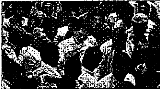
Sacked Delhi water minister Kapil Mishra addressing the media at Rajghat in New Delhi on Sunday

The allegation by Kapil Mishra, who was sacked from the AAP dispensation on Saturday night, came amid growing rumblings in the Aam Aadmi Party