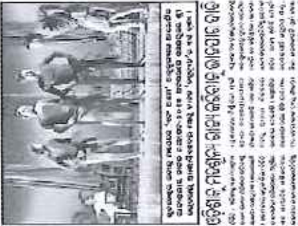
ପୁସ୍ତକ ଉଦ୍ଘୋଷଣ କରୁଥିବା କର୍ମାଳୟର ଅଧ୍ୟାୟତନା ପୁସ୍ତକ ଉଦ୍ଘୋଷଣ କରାଯାଇଛି ।

ଶିକ୍ଷା ଓ ପରିଷଦ ପରିଷଦର ୧୫ତମ ବର୍ଷ ବୃତ୍ତ ‘ଶିକ୍ଷକ ସମାଜର ବିଶ୍ୱକର୍ମା’ ଶିକ୍ଷକ ସମାଜର ବିଶ୍ୱକର୍ମା ଉପରେ ପରିଷଦର ୧୫ତମ ବର୍ଷ ବୃତ୍ତ ପ୍ରକାଶ କରାଯାଇଛି । ପୁସ୍ତକଟିଏ ଶିକ୍ଷକ ସମାଜର ବିଶ୍ୱକର୍ମା ଉପରେ ପରିଷଦର ୧୫ତମ ବର୍ଷ ବୃତ୍ତ ପ୍ରକାଶ କରାଯାଇଛି ।