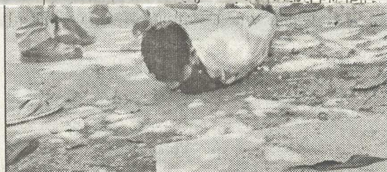
કેરાલાના કોચિ શહેરમાં પુથુલ્ચપે ખોટા નિર્માણ પામી રહેલા આઈઓસી પ્લાન્ટના વિરોધમાં સ્થાનિક લોકો દ્વારા યોજાયેલા દેખાવો દરમિયાન પોલીસ દ્વારા એક દેખાવકારની અટકાયત કરી તેની ઉપર લાઠીચાર્જ કરવામાં આવી રહેલો નજરે પડે છે.

ઈસ્કોનના આધ્યાત્મિક વડા રામાનાથ સ્વામી મહારાજે જણાવ્યું હતું કે ગાય વિશ્વ અર્થતંત્રનો પાયો છે. સવાલ માત્ર તેમની કતલ અટકાવવાનો નથી, પણ તેમને જન્મથી મરણ સુધી ખુશ રાખવાનો છે.