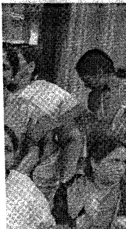
వేదిక రాజకుమారి, చిత్రంలో సీ మహిళా కమిషన్ సభ్యులు

శాడు. అయితే, నెల రోజుల్లోగా తాంటే సమాచారం అందలేదు. ఫరి 9, 2017న ప్రధానమంత్రి నీరుపై సీబీసీ ఆయన ఫిర్యాదు చేసిన దరఖాస్తును గత ఏడాది విభాగానికి పంపినట్లు పీఎంఓ తెలిపారు. తన దరఖాస్తును కారులు రెవెన్యూ విభాగానికి గడిచినా స్పందన లేదని ఖలిద్ కారు. ఈ నేపథ్యంలో రెవెన్యూ ఐచ్ఛికం ఆరిటివ్ చట్టం కింద గా దరఖాస్తుదారులకు తగిన బ్యాంకు సీబీసీ మాధుర్ అదేశం