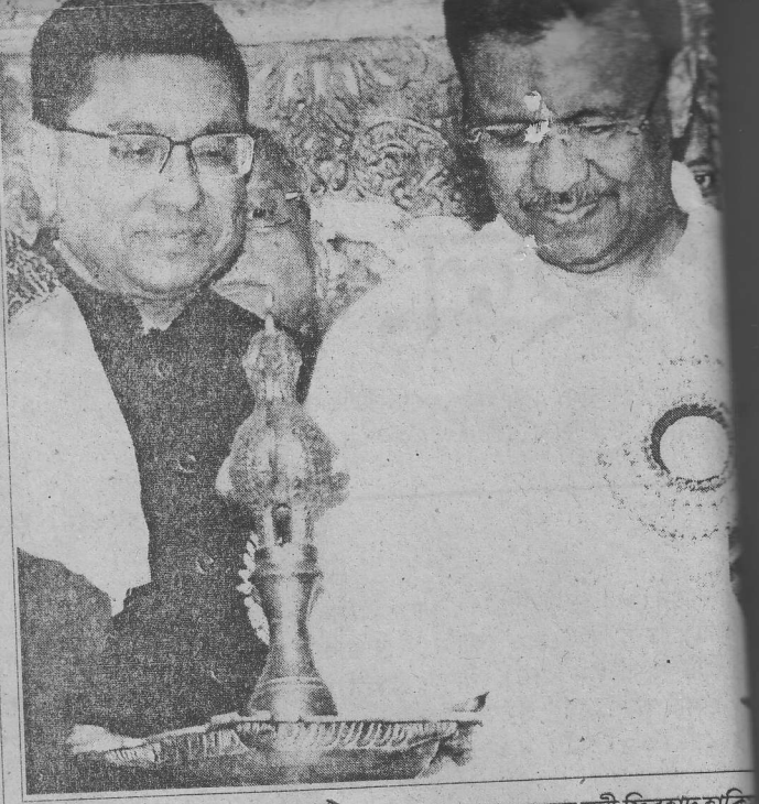
৬৬তম ডোভার লেন মিউজিক কনসার্টের সূচনা করছেন মন্ত্রী ফিরহাদ হাকি