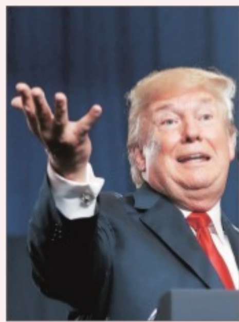
The president said White House lawyers are reviewing his proposal. It's unclear how quickly he would act and the White House did not provide further details

Asked about the legality of such an executive order, Trump said, "they're saying I can do it just with an executive order." He added "we're the only country in the world where a person comes