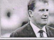
ਦ ਨਵੇਰ ਕੇਓਪ. ਸੁਰਗ ਸਿਲਬ ਸਿਮ. ਨਵੇਰ, ਬਿਸ਼ਨੋ ਸਲੇਪਰ

ਬਿਸ਼ਨੋ, 5 ਨਵੰਬਰ: ਸਾਬਕਾ ਬੁਰਾਰਨ ਮਾਯਕ ਟੇਲਰ ਨੂੰ ਸੰਸਦਵਾਰ ਨੂੰ ਚੁਣਿਆ ਆਸਟਰੇਲੀਆ ਦੇ ਡਾਈਰੈਕਟਰ ਆਉਦਾ ਤੋਂ ਅਸਤੀਫਾ ਦੇ ਕਾਰਨ ਹਿਸਾਬ ਨੂੰ ਗੱਦ ਨਾਮ ਹੋਰੀ ਡਿਫ਼ਿਅੰਡਾ ਦੀ ਖ਼ਤਨਾ ਤੋਂ ਬਚਾਉਣ ਦੇ ਖਾਤੇ ਤੇ