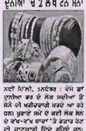
ਦੁਨੀਆ 'ਚ 2 ਲੱਖ ਤੋਂ ਜ਼ਿਆਦਾ ਮਸ਼ਹੂਰ ਫੋਟੋਬਲਾਗ ਮੈਮੀ ਸੈੱਟ ਤੋਂ ਬਾਦ ਕਰਨਗੇ ਵਾਪਸੀ

ਉਤਾਰਨ ਸਾਰੀ ਨਵੇ ਸਿੱਧੇ ਕਰਨਾ ਚੁਕਦਾ ਹੋ ਸਕਦਾ ਹੈ। ਮੁੱਖ ਖਾਰਜੀਲਾ ਜੇਲ੍ਹ ਸੁਰੱਖਿਅਕ ਅਤੇ ਚੇਅਰਮੈਨ ਹੋਵੇਗਾ ਪੀਐਚ ਟੇਲਰ ਨੇ ਆਸਟਰੇਲੀਆ ਦਾ ਆਹੁਦਾ ਛੱਡਿਆ ਹੈ। ਬੁਰਾਰਨ ਸਾਰੀ ਨਵੇ ਸਿੱਧੇ ਕਰਨਾ ਚੁਕਦਾ ਹੋ ਸਕਦਾ ਹੈ। ਮੁੱਖ ਖਾਰਜੀਲਾ ਜੇਲ੍ਹ ਸੁਰੱਖਿਅਕ ਅਤੇ ਚੇਅਰਮੈਨ ਹੋਵੇਗਾ ਪੀਐਚ ਟੇਲਰ ਨੇ ਆਸਟਰੇਲੀਆ ਦਾ ਆਹੁਦਾ ਛੱਡਿਆ ਹੈ।