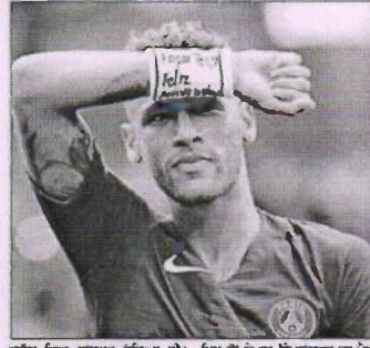
ਕਲੱਬ ਵਿਚ ਟ੍ਰਾਂਸਫਰ ਹੋਣਾ ਸੀ। ਇਸ ਤੋਂ ਨੇਮਾਰ ਦੇ ਟ੍ਰਾਂਸਫਰ ਦਾ ਮੱਸਾ

ਬਾਰਸੀਲੋਨਾ ਕਲੱਬ ਵਿਚ ਟ੍ਰਾਂਸਫਰ ਮਾਮਲੇ ਦੀ ਸੁਣਵਾਈ ਵੱਡਾ ਬੰਬ ਕਰੇਗਾ 430 ਕਰੋੜ ਰੁਪਏ ਦੀ ਰਕਮ ਲੁਕਾਉਣ ਅਤੇ ਵਰ ਚੋਰੀ ਦਾ ਦੋਸ਼