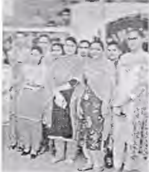
ਦੇਸ ਪ੍ਰਗਟਾਉਂਦੇ ਹੋਏ।