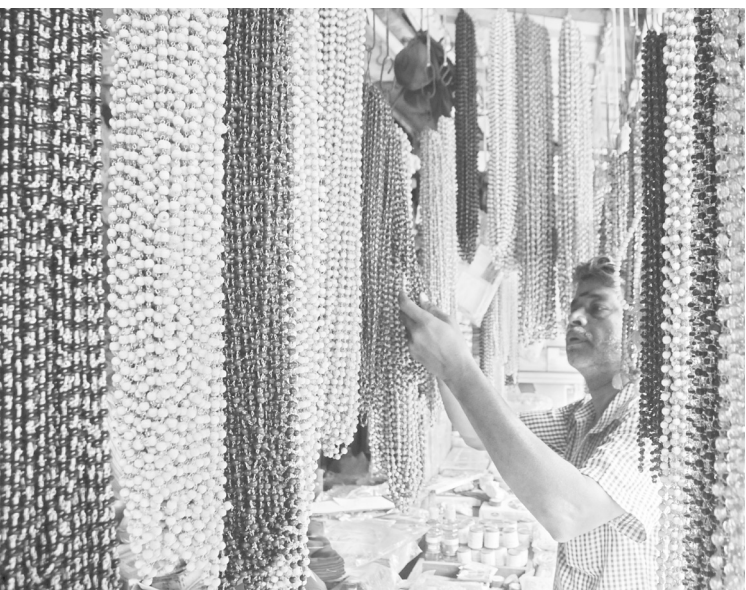
கார்த்திகை மாதம் நாளை பிறப்பத முன்னிட்டு சபரிமலை ஐயப்பனுக்கு ஏராளமான பக்தர்கள் மாலை அணிந்து கொள்வார்கள். இதற்காக சென்னையில் பல்வேறு இடங்களில் விதவிதமான மாலைகள் விற்பனைக்கு குவிந்துள்ளன.