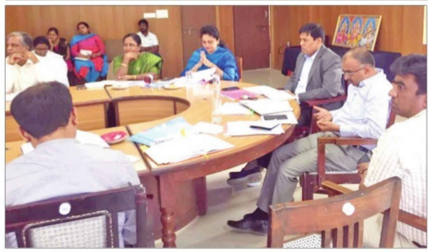
ಬೆಂಗಳೂರು ಗ್ರಾಮಾಂತರ ಜಿಲ್ಲಾಧಿಕಾರಿಗಳ ಕಚೇರಿ ಸಭಾಂಗಣದಲ್ಲಿ ಮುಖ್ಯಮಂತ್ರಿಗಳ ಸಭೆ ನಡೆಯಿತು.