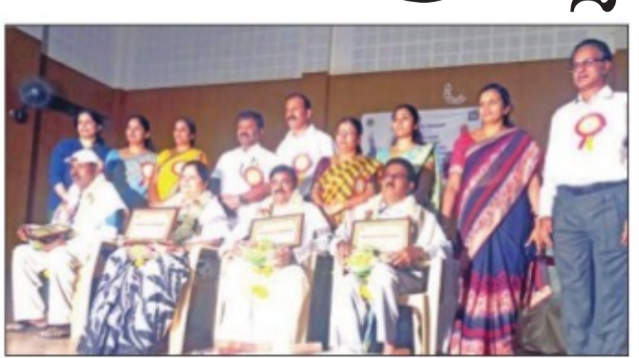
ದೇವನಹಳ್ಳಿ ಪಟ್ಟಣದ ಗಿರಿಯಮ್ಮ ಸರ್ಕಲ್ ರಸ್ತೆಯಲ್ಲಿರುವ ಅಂಜೇಡ್ಕರ್ ಭವನದಲ್ಲಿ ವಿಶ್ವವಿಕಲಚೇತನರ ದಿನಾಚರಣೆಯ ಅಂಗವಾಗಿ ವಿಕಲಚೇತನರನ್ನು ಅಭಿನಂದಿಸಲಾಯಿತು.