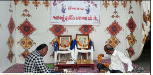
(તસ્વીર- હાર્દિક ઘાટે, દરસોલ)

દરસોલ, તલોદ તાલુકામાં શરૂ થયેલા તા. ૨૮ થી પોલીયો રસીકરણ મહાઅભિયાનમાં "પ" પ્રા. આરોગ્ય કેન્દ્રો આવેલ છે જેમાં પ્રથમ (૧) અણીયોડ (૨) આંતોલી (૩) ખેરોલ (૪) પુન્ડરી (૫) તલોદ શહેરી આવેલા છે. આ પ્રા. આરોગ્ય કેન્દ્રોમાં તા. ૨૮ના રોજ સવારથી જ પોલીયો