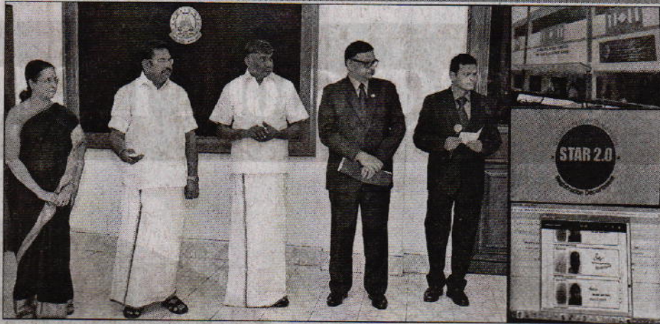
பதிவுத்துறை சார்பில் உருவாக்கப்பட்டுள்ள ஒருங்கிணைந்த வலை அடிப்படையிலான வலை அடிப்படையிலான போட்டி வாக்குமூலம்