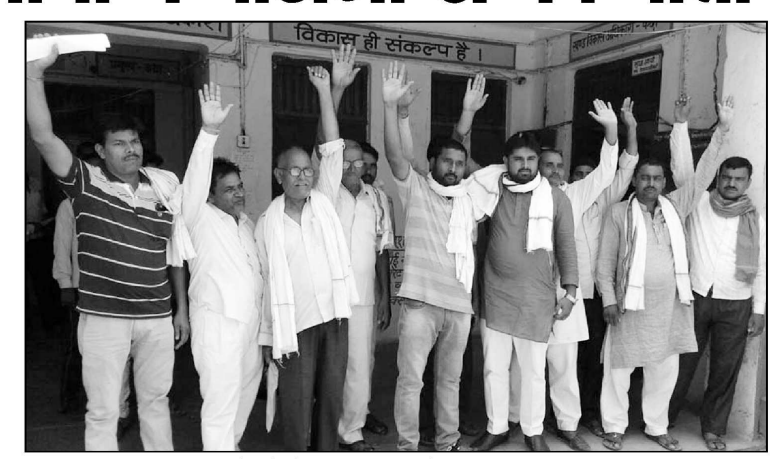
मांगों को लेकर प्रदर्शन करते सम्भल के प्रधान।

आज सुबह 6 बजे से ही धूप ने अपना असर दिखाना शुरू