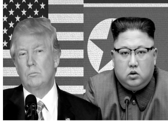
सैंडर्स ने कहा, "उत्तर कोरिया ने जो कहा उसपर अमेरिका स्वतंत्र रूप से विचार करेगा और अपने सहयोगियों के साथ करीबी सहयोग करना जारी रखेगा।"

वाशिंगटन ■ भाषा अमेरिका ने आज कहा कि वह राष्ट्रपति डोनाल्ड ट्रंप और उत्तर कोरियाई नेता किम जोंग उन के बीच होने वाली बैठक की तैयारियों में लगा है। उत्तर कोरिया ने इस ऐतिहासिक शिखर वार्ता को रद्द करने की धमकी देते हुए आरोप लगाया कि अमेरिका परमाणु निस्स्त्रोकरण पर उसे 'अलग-थलग' करने की कोशिश कर रहा है। उत्तर कोरिया की सरकारी समाचार एजेंसी केसीएनए ने कहा कि उत्तर कोरिया अपने परमाणु कार्यक्रम को एकतरफा तरीके से बंद करने के बदले में अमेरिका की ओर से वित्तीय सहायता को कभी स्वीकार नहीं करेगा।