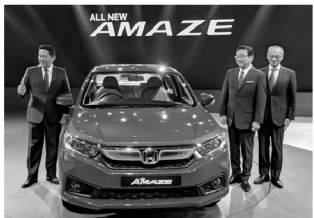
जरिये प्रीमियम सेडान का अनुभव प्रदान करती है। उन्होंने कहा कि इस नयी कार में पहली बार डीजल सीवीटी टेक्नॉलॉजी दी गई है, जो ड्राइविंग का शक्तिशाली और सुगम अनुभव प्रदान करती है। उन्नत सीवीटी के साथ यह हॉंडा का पहला डीजल इंजन है। यह टेक्नॉलॉजी