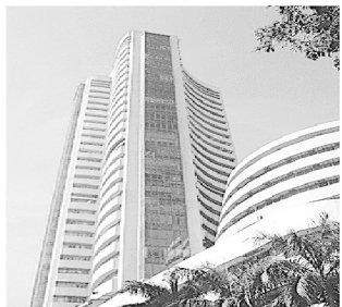
बीएसई का संसेक्स करीब 100 अंकों की गिरावट लेकर 35452.35 अंक पर खुला और लिवाली के जोर पकड़ने पर यह 35543.89 अंक के उच्चतम स्तर तक चढ़ा। इसीबीच बिकवाली शुरू हो गयी जिससे यह 10699.70 अंक के निचले स्तर तक फिसल गया। अंत में यह पिछले दिवस के 10801.85 अंक की तुलना में 60.75 अंक अर्थात 0.56 अंक गिरकर 10741.10 अंक पर रहा। बीएसई के अधिकांश समूह गिरावट में रहे जिसमें एनजी 1.75 प्रतिशत, बैंकिंग 1.17 प्रतिशत और तेल एवं गैस 1.58 प्रतिशत प्रमुखता से शामिल है। बढ़त में रहने वालों में रिजल्टी 1.99 प्रतिशत, एफएमसीजी 1.65 प्रतिशत और टेक 0.11 प्रतिशत शामिल है। बीएसई में कुल 2757 कंपनियों में कारोबार हुआ जिनमें से 993 बढ़त में और 1645 गिरावट में रहे जबकि 119 में कोई बदलाव नहीं हुआ।

नंबई ■ वार्ता वैश्विक स्तर से मिले नकारात्मक संकेतों के साथ ही गुरुवार पर कर्नाटक विधानसभा चुनावों में केन्द्र में सत्तारूढ़ भारतीय जनता पार्टी को बहुमत नहीं मिलने से निराश निवेशकों की बिकवाली का असर आज भी घरेलू शेयर बाजार पर दिखा जिससे यह गिरावट लेकर बंद हुये। बीएसई का 30 शेयरों वाला संवेदी सूचकांक संसेक्स 155अंक गिरकर 35387.88 अंक पर और नेशनल स्टॉक एक्सचेंज (एनएसई) का निफ्टी 60.75 अंक लुढ़कर 10741.10 अंक पर बंद हुआ। बड़ी कंपनियों की तुलना में मझौली कंपनियों में कम बिकवाली हुयी जबकि छोटी कंपनियों में बढ़त बनाने में सफल रही। इससे बीएसई का मिडकेप 0.27 प्रतिशत उतरकर 16024.86 अंक पर रहा जबकि स्मॉलकेप 0.06 प्रतिशत बढ़कर 17536.01 अंक पर रहा।