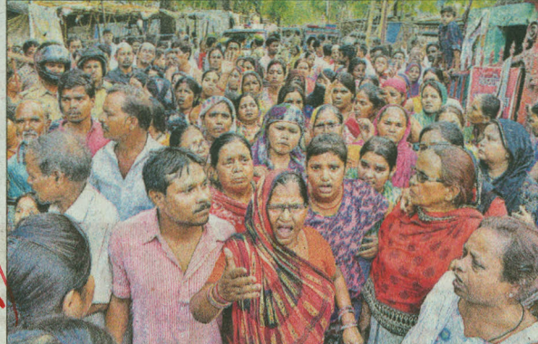
सेटलमेंट कॉलोनी खाली कराने को लेकर लोगों ने पुलिस-प्रशासन से विरोध जताया।

बंद रहा। शुक्रवार सुबह लगभग पौने दस बजे लखनऊ जा रही 64206 मेमू जयपुरिया क्रॉसिंग पार कर रही थी, तभी बस्ती से बाइक सवार एकाएक ट्रैक किनारे आ गए। इंजन के बंफर से बाइक के टकरा लगी तो घिसटती चली गई।