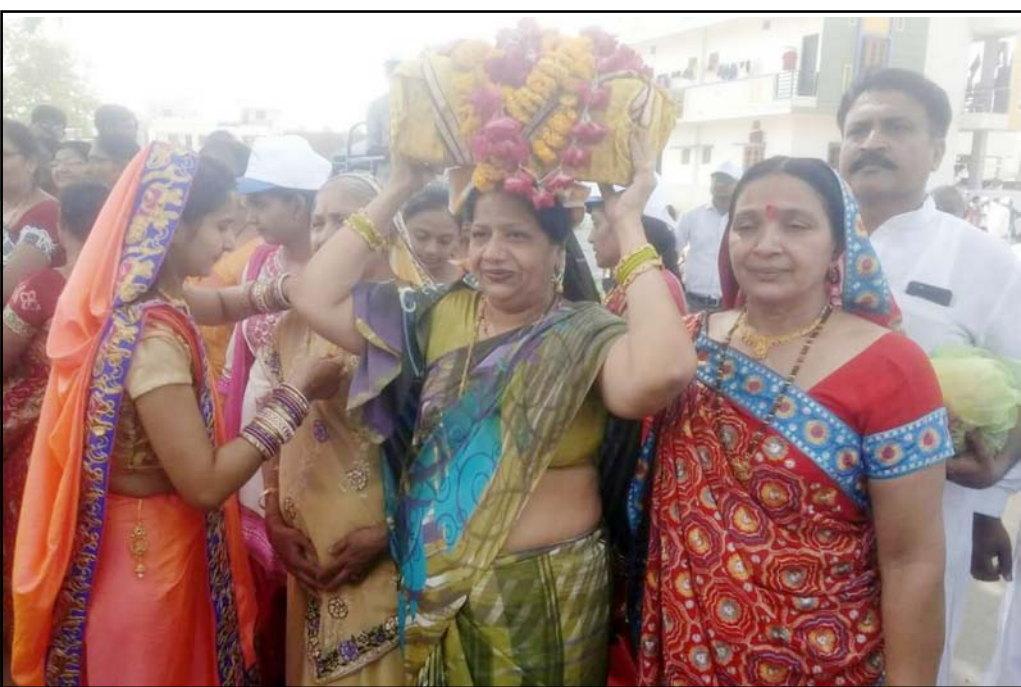
છોટાઉદેપુર માં "શ્રી શિવ મહાપુરાણ જ્ઞાનયજ્ઞ કથા મહોત્સવ" નું આયોજન શ્રી છોટાઉદેપુર કચ્છ કડવા પાટીદાર સનાતન સમાજ દ્વારા કરવામાં આવ્યું જે તસ્વીરમાં બેઠી શકાય છે.