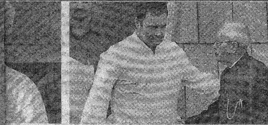
జూని మట్టిపాటి సంగర్ రాజీవ్ గాంధీ సమాధి వద్దకు వస్తున్న రాహుల్ గాంధీ, మాజీ రాష్ట్రపతి ప్రజాపతి ముఖర్జీ