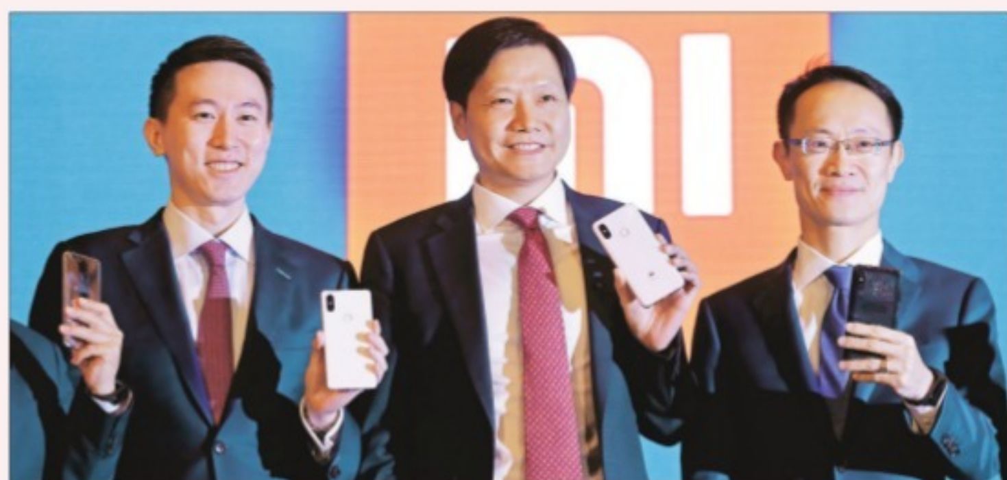
Xiaomi's founder, chairman and CEO Jun Lei (centre) poses with senior company officials at a news conference in Hong Kong on Saturday

Xiaomi shares will start trading on Hong Kong's stock exchange on July 9 under the