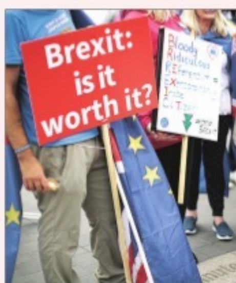
An anti-Brexit protest in London recently

And the uncertainty over what relations with the EU will be when Brexit becomes official on March 29, 2019 could make matters worse. Prime Minister Theresa May's Con-