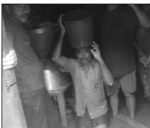
बारिश के बाद सड़कों पर जगह-जगह कीचड़ व जलभराव की समस्या उत्पन्न हो गई, वही कई ग्रामीण इलाकों में पानी लोगों के मकानों में घुस गया। बारिश के बाद लोगों को गर्मी से भी राहत मिली। मौसम सुहावना हो गया और इस सुहावने मौसम का लोगों ने इधर-उधर घूम-फिरकर जमकर आनन्द उठाया। पिछले काफी दिनों से चिलचिलाती गर्मी पड़ रही थी। गर्मी के चलते लोगों का हाल बेहाल हो गया था। वह घरों में कैद होकर रह गये थे। एक तरफ चिलचिलाती गर्मी पड़ रही थी और दूसरी तरफ बिजली की आंख मिचौली चल रही थी, इससे हर कोई परेशान आ गया था। लेकिन गुरुवार की सुबह जिले में कई स्थानों पर झमाझम बारिश हुई। इससे मौसम खुशगवार हो गया और लोगों

को गर्मी से काफी राहत मिली। वह घूमने-फिरने के लिए सड़कों पर निकल पड़े। उन्होंने बाजार में गरम आइटमों का जमकर लुफ्त उठायी। सुबह से लेकर शाम तक चाट-पकोड़े व टिक्की वालों की दुकानों पर लोगों की भीड़ लगी रही। नगर के पक्का घाट पर काफी लोग घूमने-फिरने आये और उन्होंने इस सुहावने मौसम का मजा लिया। इसके अलावा बारिश