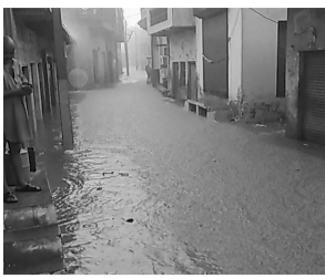
बारिश के बाद गलियों में भरा पानी, सररपुर कला गांव में मकानों में घुसे पानी को निकालते लोग।