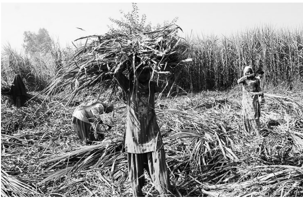
The government wants to finalise these schemes and announce them before the harvesting of kharif crops that begins from October onwards, the sources added

Centre may to have bear ₹120-150 billion annually to compensate farmers in case prices fall below the MSP in all crops except rice and wheat which are already being procured by state-run Food Corporation of India (FCI).