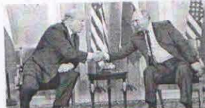
US President Donald Trump is no fan of American journalists, but he might love what the Russian media are saying about him ahead of his meeting with Russian President Vladimir Putin later on Monday.

Unusually sympathetic to Trump, they described him as 'battered by domestic political challenges' a problem Putin doesn't face after 18 years of stalling political opposition and by special investi-