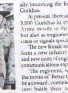
ally becoming the brigade of Gurkhas.

British began recruiting Gurkhas in 1815 during the Anglo-Nepal War. Following the Partition of India in 1947, an agreement between Nepal, India and Britain meant four Gurkha regiments from the Indian Army were transferred to the British Army event-