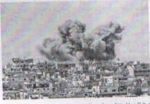
Syrian government forces targeted a rebel-held area near the Israeli-occupied Golan Heights, activists have said.

Syrian President Bashar Assad said on Sunday the success in driving the opposition out of Daraa embodies the will of his army and allied forces to "liberate all of Syrian territo-