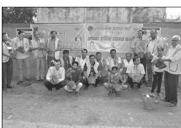
टटरी के वैदिक कन्या डिग्री कॉलेज में वृक्ष रोपते लायन्स क्लब के कार्यकर्ता ।