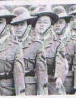
(Queen Elizabeth II), and it is right that women have the opportunity to serve in this elite group, said UK Defence Secretary Gavin Williamson.

The Gurkhas are renowned as one of the best fighting forces in the world with a proud history of serving Her Majesty