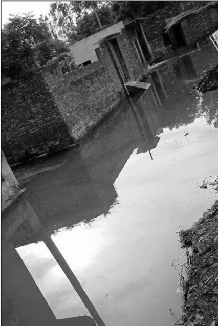
गांव गढ़ी दौलत की गलियों में भरा तालाबों का गंद पानी।