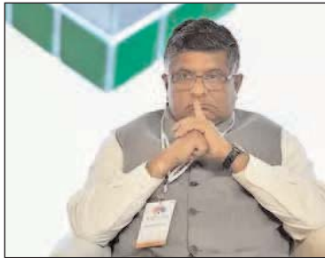
for electronics and IT, law and justice Ravi Shankar Prasad said. "The expansion of digital technology in our country will add 5% more growth in

Now, no villager will need to go to cities for the services as those can be availed through CSCs, union minister