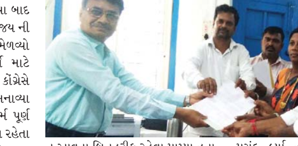
ન આવતા બિનહરીફ રહેવા પામ્યા હતા. બેરગામ તાલુકા પંચાયત માં કોંગ્રેસે ૧૨ અને ભાજપે ૪ બેઠક મેળવી