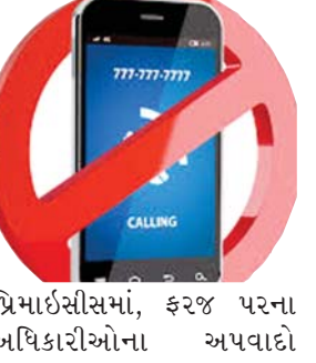
પ્રિમાઈસીસમાં, ફરજ પરના અધિકારીઓના અપવાદો

વડોદરા : શહેર પોલીસ કમિશનરશ્રીએ જેલવાસ ભોગવતા અંતેવાસીઓ દ્વારા અનિચ્છનીય પ્રવૃત્તિઓ થતી અટકાવવાની પૂર્વ તકેદારીના રૂપમાં કાયદાની જોગવાઈઓ પ્રમાણે જાહેરનામું બહાર પાડ્યું છે. તેના દ્વારા વડોદરા સેન્ટ્રલ જેલ અને તેની