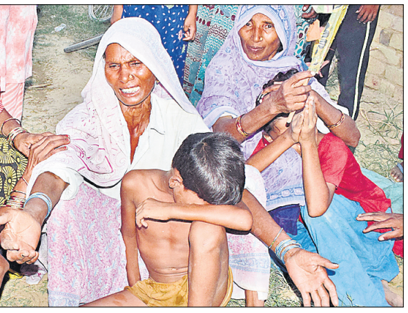
ग्रामीणों की मौत के बाद विलाप करती परिवार की महिलाएँ।