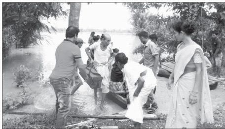
নিৰাপদ আশ্ৰয়ৰ সন্ধানত গোলাঘাটৰ এটা বন্যভাঙ্গ পৰিয়াল

জনগণ সেৱা, পতিস্বাস্থ্য, ৩ আগষ্ট : বহুদিনৰ পিছলৈ বিহালীৰ আৰক্ষী বিষয়া বিৰুদ্ধে বাহুজৰা অভিযোগ জনগণ সেৱা, পতিস্বাস্থ্য, ৩ আগষ্ট : বহুদিনৰ পিছলৈ বিহালীৰ আৰক্ষী বিষয়া বিৰুদ্ধে বাহুজৰা অভিযোগ