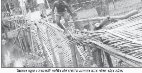
উন্নয়নৰ নামত ১৫ বছৰীয়া অসমত এনআৰচি পূৰ্ণাংক খৰচা প্ৰকাশৰ পাছতে কটকটীয়া নিৰাপত্তা ব্যৱস্থা

জনগণ সেৱা, তিলাপাৰা, ৩ আগষ্ট : ৬ বছৰীয়া অসমত এনআৰচি পূৰ্ণাংক খৰচা প্ৰকাশৰ পাছতে কটকটীয়া নিৰাপত্তা ব্যৱস্থা জনগণ সেৱা, তিলাপাৰা, ৩ আগষ্ট : ৬ বছৰীয়া অসমত এনআৰচি পূৰ্ণাংক খৰচা প্ৰকাশৰ পাছতে কটকটীয়া নিৰাপত্তা ব্যৱস্থা