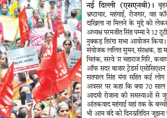
आम आदमी बुनियादी सुविधाओं से दूर : पम्पा नई दिल्ली (एसएनबी)