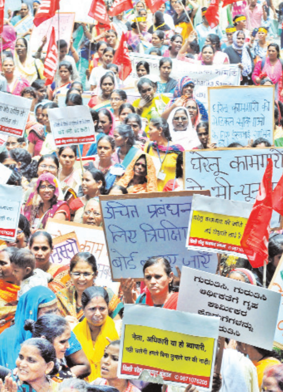
संसद मार्ग पर बृहस्पतिवार को अपनी मांगों को लेकर प्रदर्शन करते दिल्ली घरेलू कामगार संगठन के कार्यकर्ता।