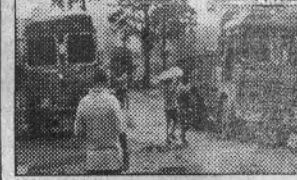
মাওবাদীদের লাগানো আগুন বিধ্বস্ত দুটি গাড়ি।

দান্তেওয়াড়া (ছত্তিসগড়), ১০ আগস্ট : একাধিক গাড়িতে আগুন ধরিয়ে দিল মাওবাদীরা। বৃহস্পতিবার ছত্তিসগড়ের দান্তেওয়াড়া জেলায় ঘটনাটি ঘটে। দান্তেওয়াড়ার বাছেলি শহরের কাজে রাস্তা নির্মাণের কাজ চলছে। বৃহস্পতিবার আড়াইটে নাগাদ সেখানে হামলা চালায় প্রায় ৪০ জন সশস্ত্র মাওবাদী। পাঁচটি ট্রাকে আগুন ধরিয়ে দেয়। শুধু তাই নয়, ট্রাক চালকদের মোবাইলগুলিও ছিনিয়ে নেয় মাওবাদীরা। এক সপ্তাহের মধ্যে ছত্তিসগড়ে এটা তৃতীয় মাওবাদী হামলা। এর আগে ৯ আগস্ট কামারুল স্টেশনের কাছে রেললাইন উপড়ে দিয়েছিল তারা। পাশাপাশি দুটি যাত্রীবাহী বাস এবং একটি ট্রাকে আগুনও ধরিয়ে দিয়েছিল।